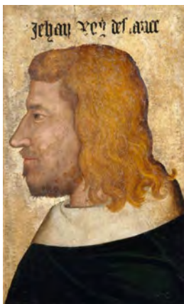
Jean II le Bon , Anonyme français

Pour la première fois, on ne montre pas le roi en prière comme au Moyen Âge, mais regardant ses sujets. Son visage n'est plus de profil mais de \frac{3}{4} face. Il est en costume de cour mais sans couronne !