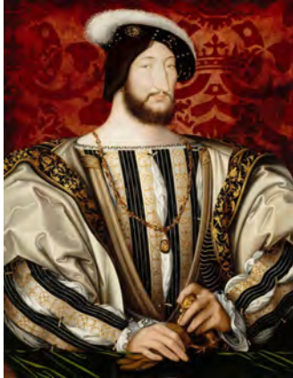
François I er , Jean Clouet

François I er est considéré comme le premier roi de la Renaissance française. Il règne de 1515 à 1545, date de sa mort.