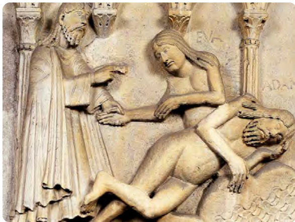
Dieu crée Adam et Ève , Wiligelmo, XI e -XII e siècle. Cathédrale de Modène

À l'exception d'Adam et Eve, il y a très peu de nu dans l'art médiéval. Botticelli rompt avec la représentation du corps de l'époque et peint la déesse en s'inspirant d'une célèbre sculpture antique, la Vénus Pudique . En plaçant au centre de sa composition la déesse nue, Botticelli innove non seulement sur le plan formel mais aussi intellectuel : la nudité est légitimée et glorifiée grâce à l'antique qui est devenu un modèle de référence dans les arts et dans la pensée.