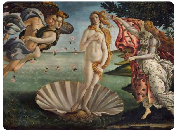
La Naissance de Vénus , Sandro Botticelli. Florence, Galerie des Offices