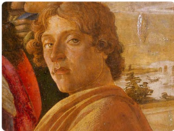
Autoportrait de Sandro Botticelli , détail de L'Adoration des Mages . Florence, Galerie des Offices